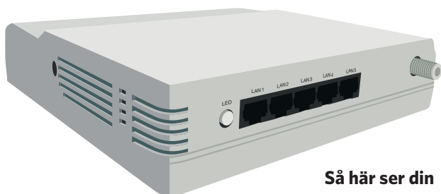
Så här ser din anslutningsbox ut.

I ditt hem finns en anslutningsbox installerad, den gör det möjligt att koppla in dator, telefon och TV till Falu Stadsnät. I den här foldern berättar vi vilka tjänster du har tillgång till, hur du skaffar dem och kopplar in dem i din bostad. Om du skulle få problem med att installera dina tjänster kontaktar du din valda tjänsteleverantör.